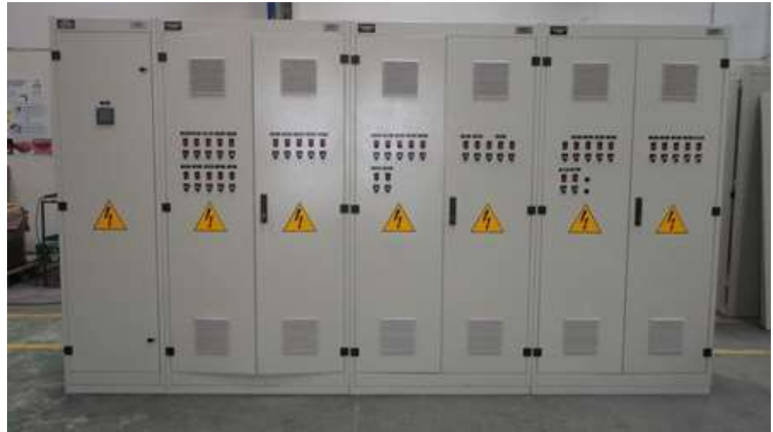
POLLOS EL BUCANERO