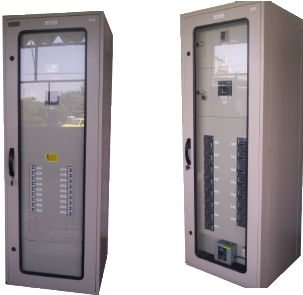
EMSA – S/E Catama 34.5/13.2 KV Servicio Auxiliares AC DC