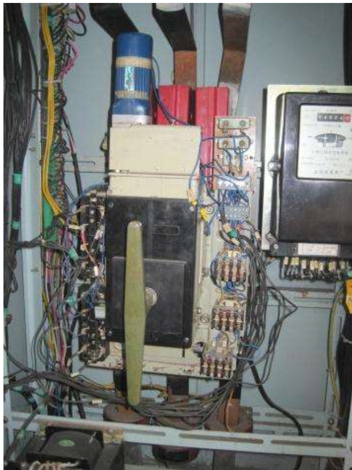
PCH SILVIA VATIA S.A. E.S.P.