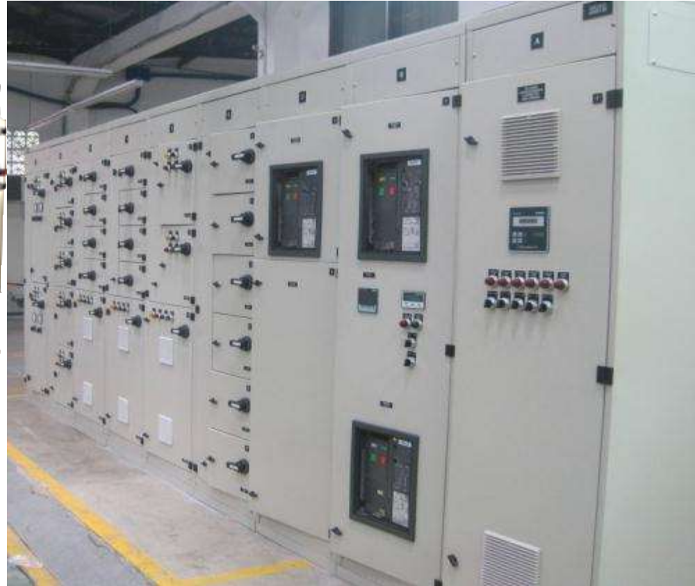
GOODYEAR CCM CON PROTOCOLO DEVICE NET