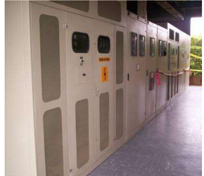
Calzado Venus S/E 34,5KV 480V Acopi Yumbo