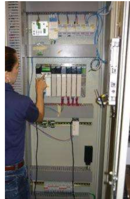
ECOPETROL CANTAGALLO Y YARIGUI TABLEROS PARA SUPERVISIÓN Y CONTROL DE SISTEMA DE GENERACIÓN DE 4.3 MVA 13.2 KV Y 4.16 KV