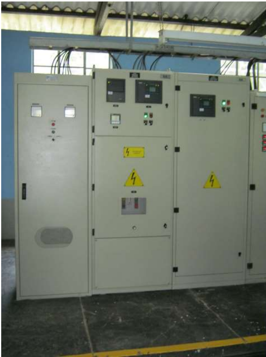
Celdas de Media Tensión y protección de Transformador.