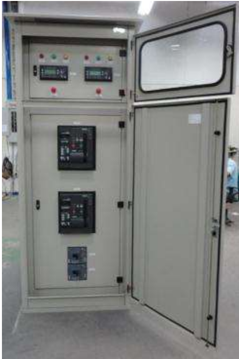
ECOPETROL ORITO PUTUMAYO TABLERO DE SINCRONISMO 600KVA 480 V