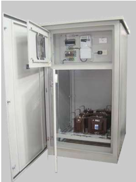
Medición de Frontera Suministro para Ecopetrol Orito