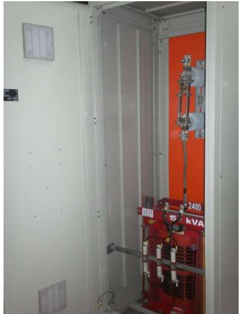
Celda de Puesta a Tierra neutro Generador (Sistema de Alta impedancia)